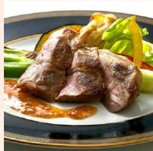
1枚 100g / 冷凍