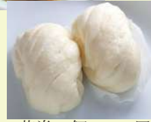
花巻 2個 150円